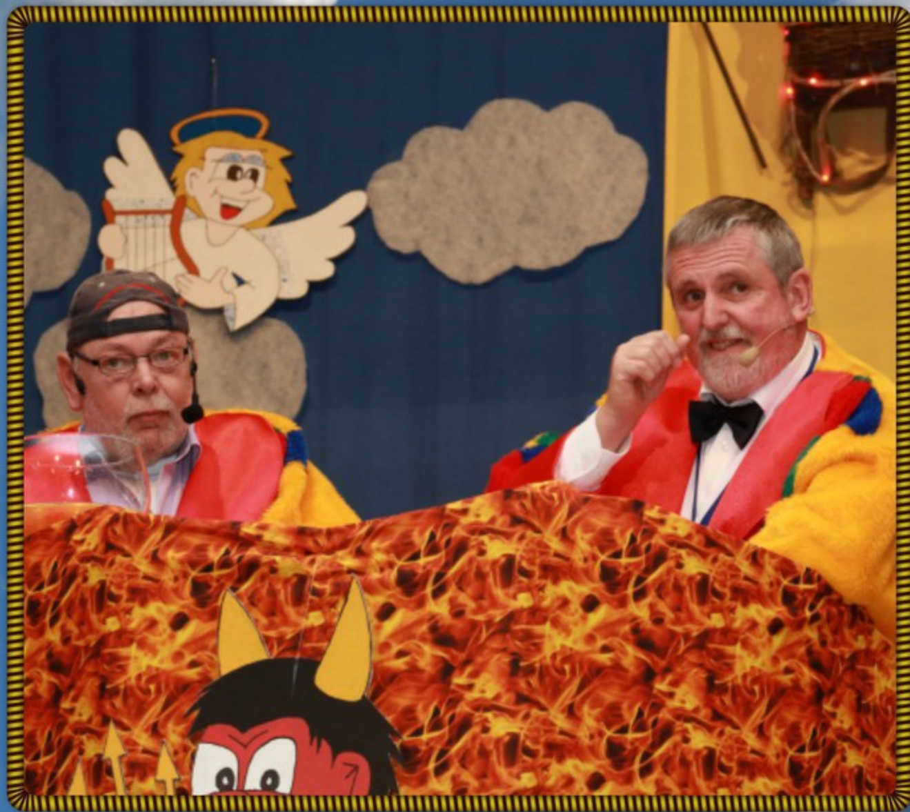
Ötsch und Dötsch