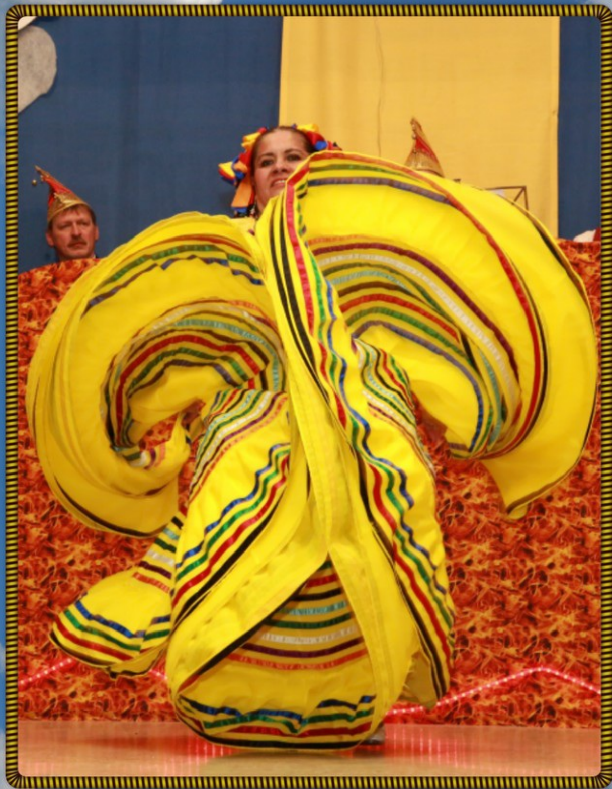
Tanz aus Halisco